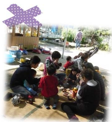
お外で食べると、やっぱり美味しい！

思いっきり遊んだあとは、やっぱりお腹がペコペコに！アウトドアクッキングでは、持ち寄り野菜で作ったお味噌汁やアツアツの焼き芋を頬張りました。