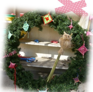
インディアンクロスの リースとすすきのふくろう