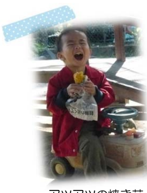
アツアツの焼き芋 おいしい！！